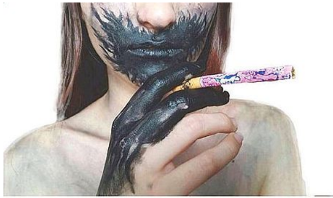
Spegni la sigaretta, accendi i tuoi sogni