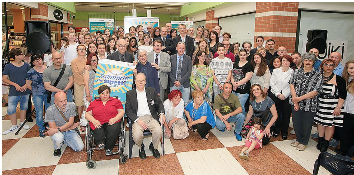
Foto di gruppo al centro commerciale La Rotonda per tutti i premiati di "Scommetti che smetti?" edizione 2016 e dei concorsi collegati